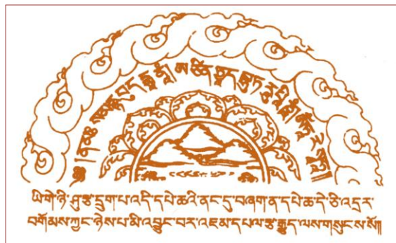
此咒置经书中可灭误跨之罪